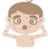
جُدْرِي المَاء (المنقر)